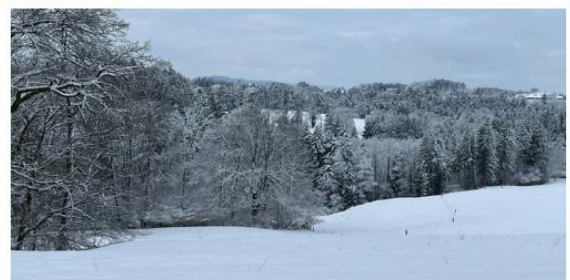
Anfangs Januar Richtung Mutwiler-Tobel.