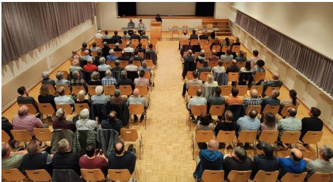
Gemeinderatskanzlei / Stimmbüro

Im Anschluss sind Sie herzlich zu einem Apéro und gemütlichen Zusammensein im Gemeindesaal eingeladen.