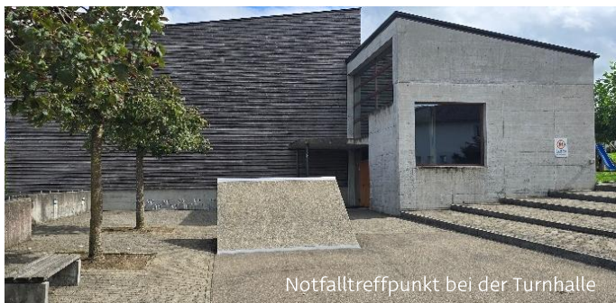
Notfalltreffpunkt bei der Turnhalle

Im Ernstfall dient der Notfalltreffpunkt Niederbüren als zentrale Anlaufstelle für Informationen und Hilfe. Der Standort befindet sich beim Primarschulhaus Niederbüren, Turnhalle, Gossauerstrasse 25. Dort erhalten Sie von den Behörden wichtige Mitteilungen oder können Unterstützung anfordern.