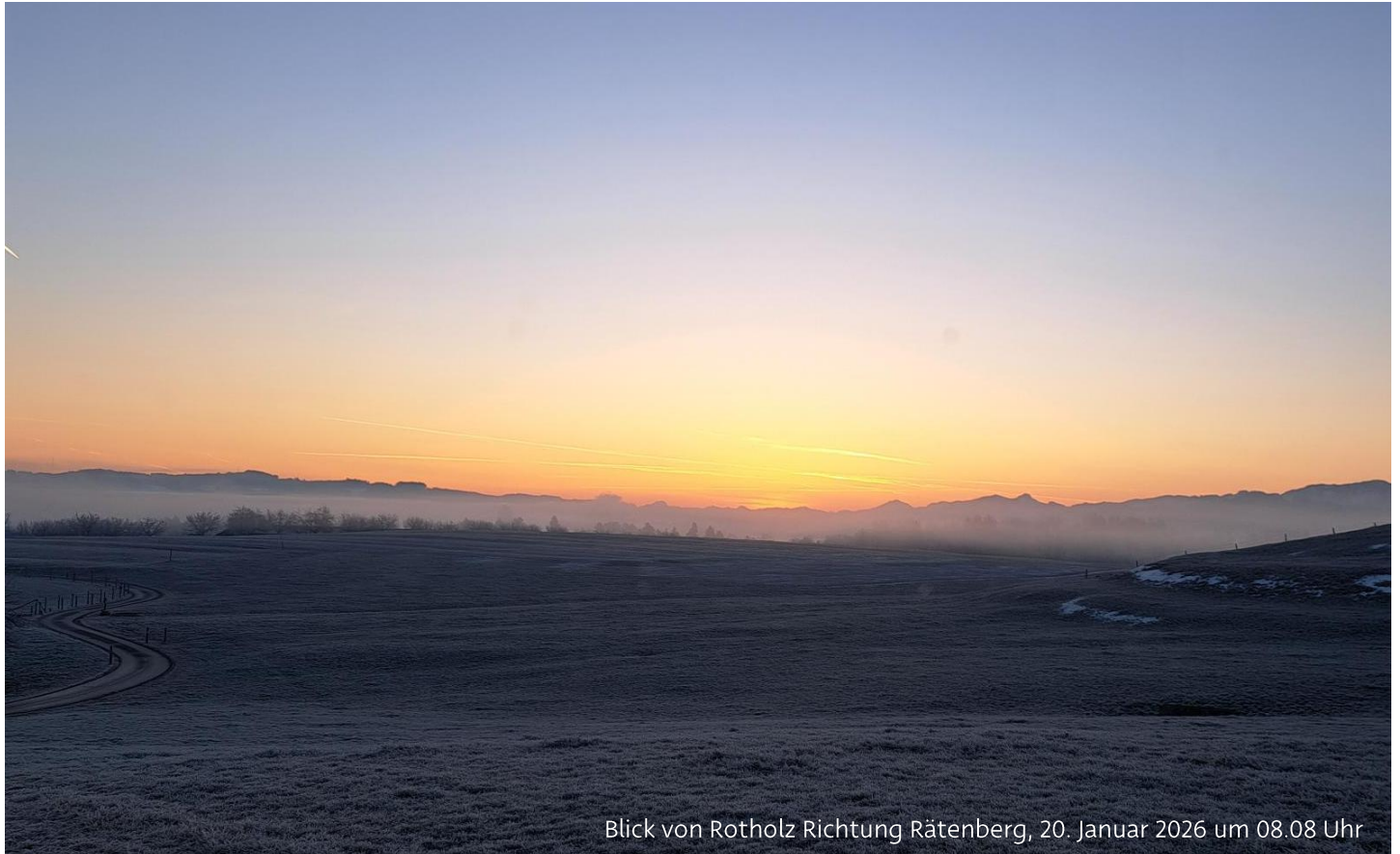
Blick von Rotholz Richtung Rätenberg, 20. Januar 2026 um 08.08 Uhr