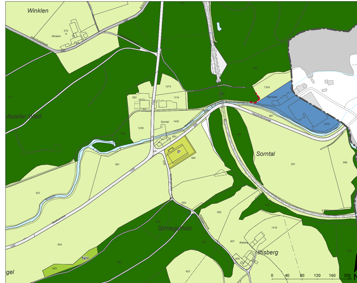
Amtliche Vermessung: Stand April 2024, AREG Kanton SG Umliedende Gemeinde: Bundesamt für Landestopografie swisstopo 2023