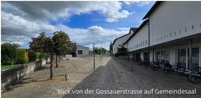
Blick von der Gossauerstrasse auf Gemeindegaststätte

Blieben Sie ruhig, hören Sie Schweizer Radio / informieren Sie sich über Alertswiss und folgen Sie den Anweisungen der Behörden.