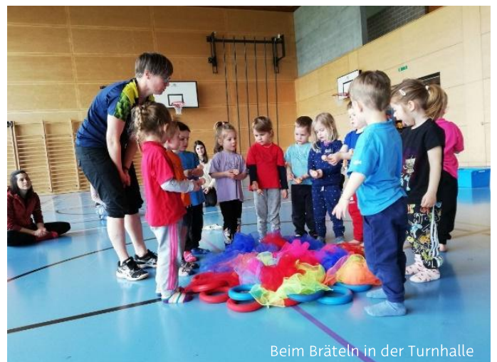
Beim Bräteln in der Turnhalle