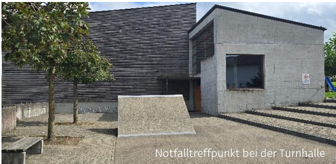
Notfalltreffpunkt bei der Turnhalle

Mit einfachen Vorbereitungen leisten Sie einen wichtigen Beitrag für Ihre eigene Sicherheit und für die ganze Dorfgemeinschaft.