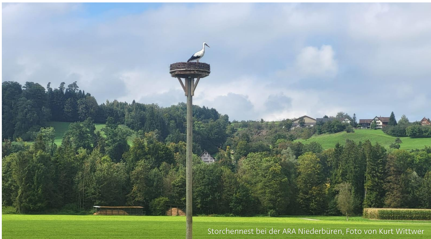
Storchennest bei der ARA Niederbüren, Foto von Kurt Wittwer