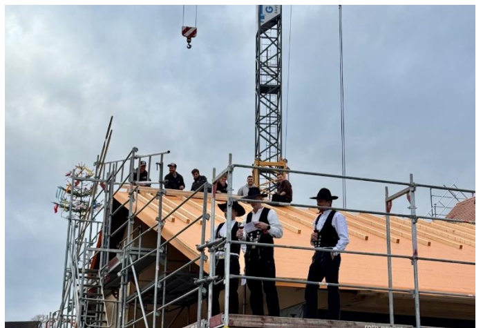
Landgasthof zur Alten Herberge