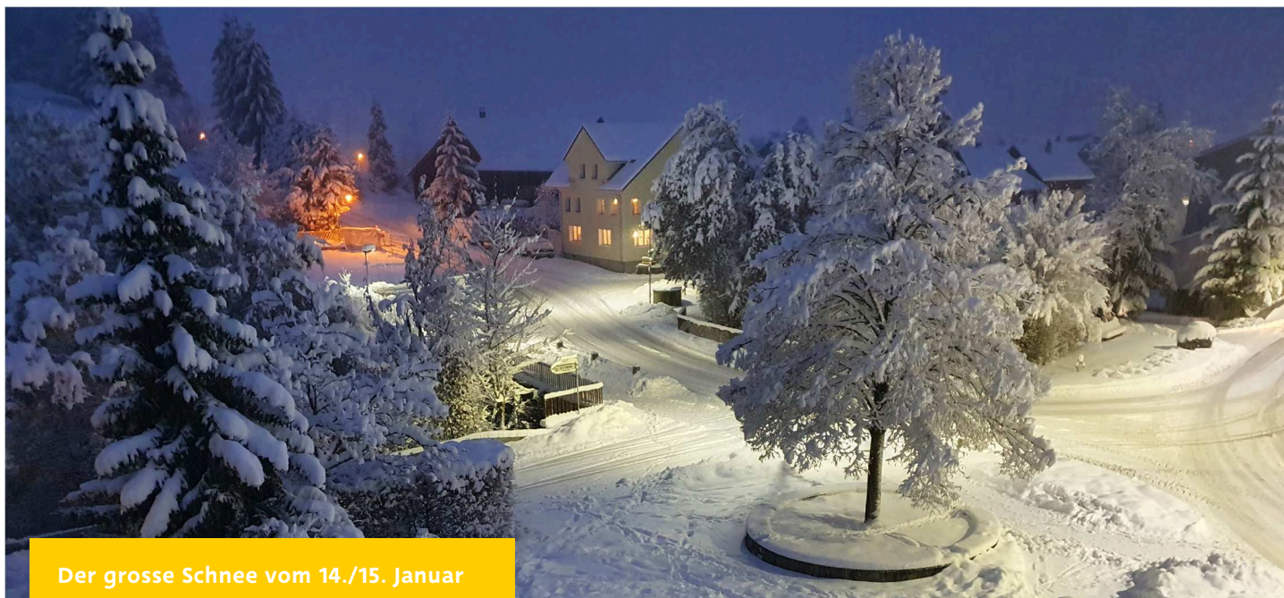
Der grosse Schnee vom 14./15. Januar