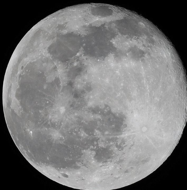
Vollmond vom 18. Januar – von der Engelwiesstrasse aus fotografiert