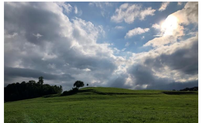
Ende August zwischen Rätenberg und Storcheegg