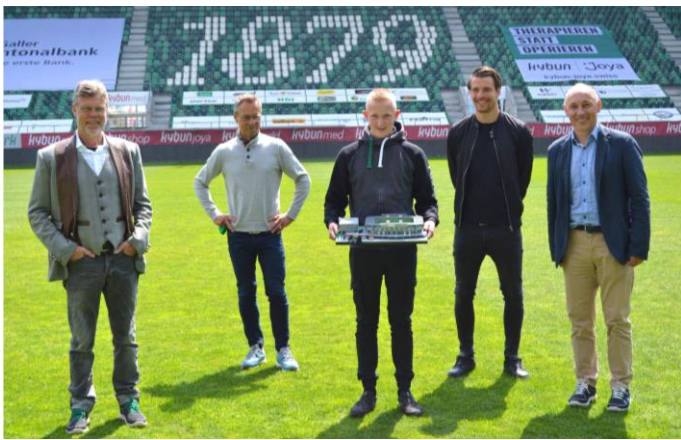
Schulrat und Schulleitung OZ Thurzelg